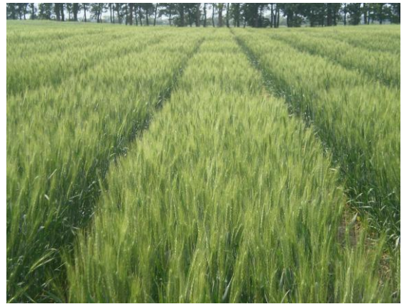
Розсадник випробувань нащадків пшениці 2-го року