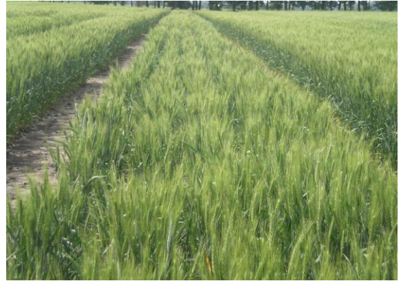
Розсадник випробувань нащадків пшениці 1-го року