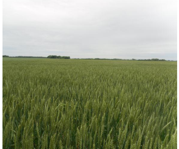
Розсадник розмноження пшениці 1-го року

Кращі за продуктивністю потомства, що за морфотипом, фенофазами та імунністю не відхиляються від типовості сорту, висівають (не менше 120 потомств) у розсаднику випробування потомств другого року (РВ2р). Польові спостереження, облік, оцінку та вибракування проводять за схемою, аналогічною РВ1р. Потім кожен ділянку, що залишилась після оцінки, збирають, зерно очищують та зважують. Кращі родини об'єднують і висівають у розсаднику розмноження першого року (РР1р).